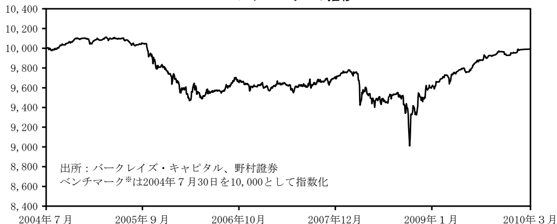
ベンチマーク※の推移

当期の変動利付日本国債市場は、財務省による変動利付日本国債の買入消却が継続的に行われたことなどが需給へのサポート要因となり、概ねしっかりとした地合いとなりました。加えて、国債増発の懸念から長期金利に上昇圧力がかかり、長短金利差が拡大（変動利付日本国債の理論価格にはプラスに影響）したことも変動利付日本国債市場へのプラス要因となりました。結果として、期を通じてみると前期比上昇して終了しました。